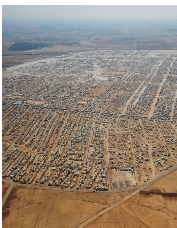
Fig.1: Vista aérea campo de Zaatari Jordania.

Los niños son los que sufren cada día privaciones dentro de Zaatari ya que la comunidad internacional les niega los fondos que necesitan. Es el campo de refugiados que más dinero necesita ya que es uno de los que más población alberga. En muchos de los casos debido a situaciones precarias que precisan urgente solución a corto plazo se olvidan cosas necesarias como es enseñar una educación básica a los que van a ser el futuro, ¿Estamos hablando de una generación perdida?. Muchas ONG como UNICEF, Save the Children, Adefis Juventud Internacional... lo están intentando evitar, pero los recursos que tienen son insuficientes, para ellos mantener las pocas escuelas que tienen es crucial, pero tienen que pagar a un profesorado, material, agua, libros... con escasos recursos