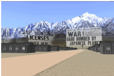
Fig.4: Beyond the Manzanar (2000), Tamiko Thiel.

El principal referente artístico es la obra de Beyond the Manzanar (2000) de Tamiko Thiel y Zara Housmand. Manzanar fue el primero de los campos de internamiento para encarcelar a japoneses-americanos durante la Segunda Guerra Mundial. Utiliza la técnica de realidad virtual 3D interactiva. En la descripción de su obra destacan: “Mientras exploras el campamento, tu sentido cinestésico se compromete a subrayar el impacto emocional del confinamiento. Tus ojos ven los pasos que salen del valle, pero te paras en la vaya y no puedes avanzar. Confinado dentro del campamento, no tienes donde ir, sino hacia dentro, hacia el refugio de la memoria y la fantasía”. (Thiel 2000).